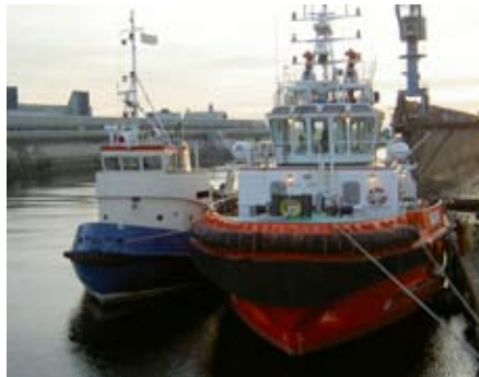
Oscar och Ägir