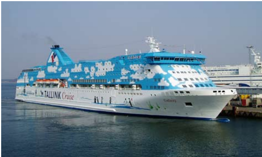
Galaxys exteriör har formgivits av den estniska konstnären Navitrolla.