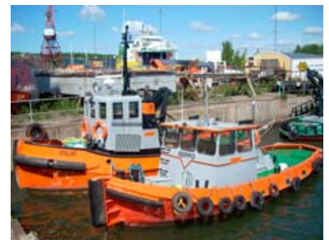
Goliat och Seppo