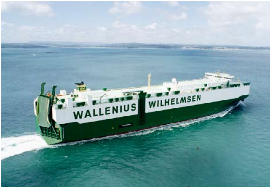
Faust levererades i fjol.