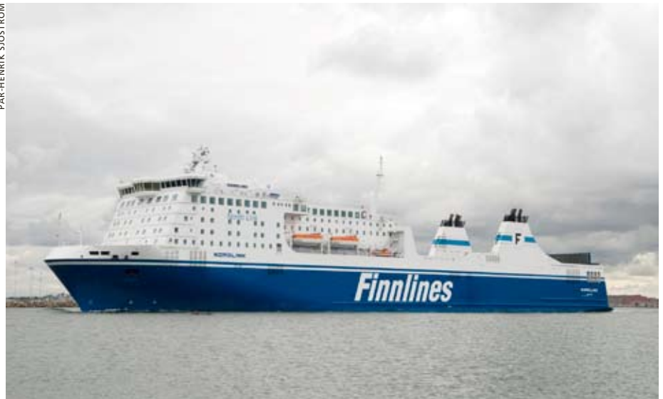
Nordlink levererades till Rederi AB Nordö-Link/Finnlines Ship Management 2007.