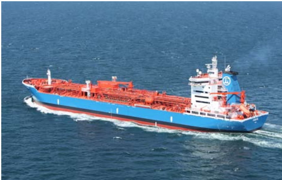
Furevik, ex Bro Erik.