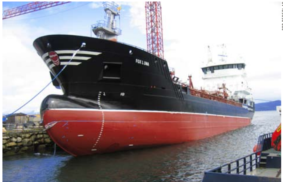
Fox Luna byggs vid Aas Mek Verksted i Norge och kommer att levereras under sommaren.