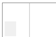
Kvartssida stående Storlek: 87×112 mm 8 700 kr